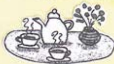
おはなしの会アリス:共催

お茶を飲みながら ゆったり、のんびり 出産の不安やまよひ... あれこれ話そう♪