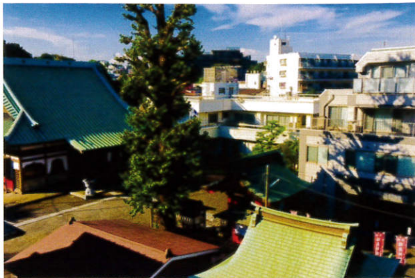
仏の教えのあるご供養 古来から受け継ぐ葬送文化の伝承