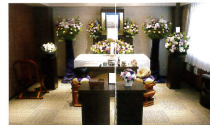
〔2F〕一蓮の間…祭壇飾りの一例 浄土曼荼羅による極楽浄土の世界観の演出