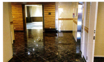
〔1F〕ロビー 受付や会葬御礼品の引換所として