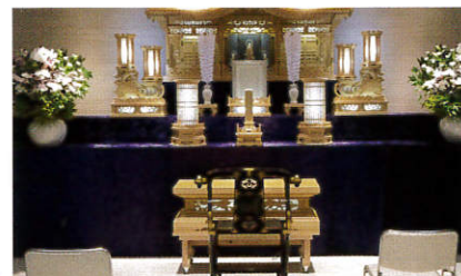
〔1F〕安養の間…祭壇飾りの一例 阿弥陀三尊による極楽浄土への導き