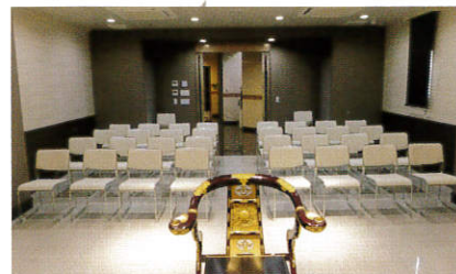
〔1F〕安養の間(背面)…40席 石調と木目調を融合させた安らぎの内観