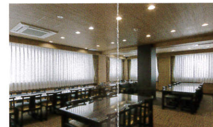
〔2F〕和合(わごう)の間…40席 故人を偲ぶ御斎(会食)場所として