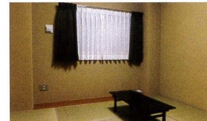
〔1F〕本業(ぎょうよう)の間 導師控室や打合せ場所として