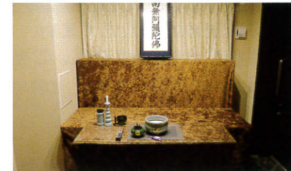
〔1F〕名号(みょうごう)の間 安置室…24時間受付対応 面会時間10時～16時