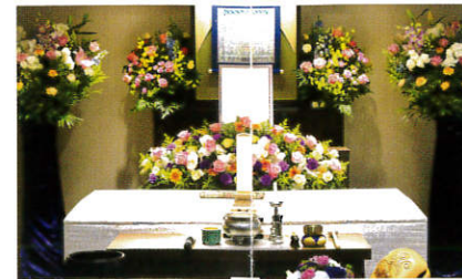
〔2F〕一蓮(いちれん)の間(正面) 小式場 兼 遺族控室…祭壇・仏具一式 完備