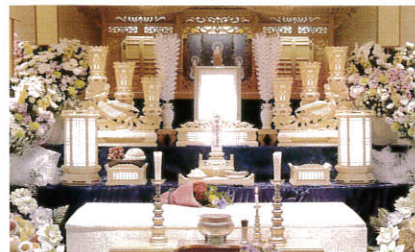
〔1F〕安養(あんよう)の間(正面) 式場…白木祭壇・仏具一式 完備