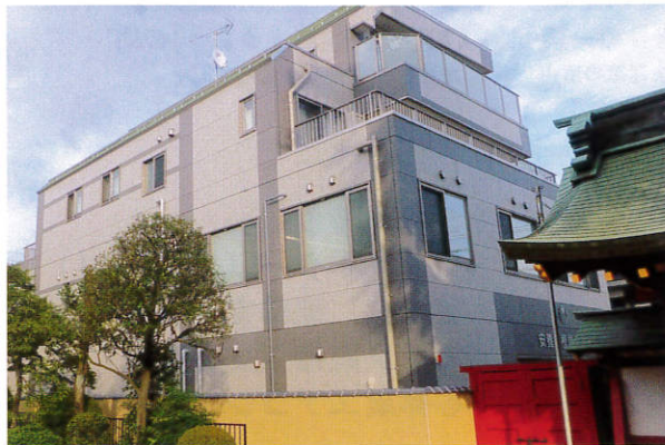
檀信徒であるからこそ 享受できる安心感と利便性