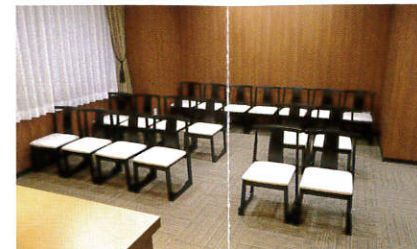
〔2F〕一蓮の間 (背面)…20席 少人数でのご供養の際などに便利です