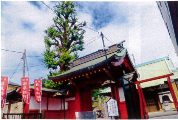
壮麗で伝統のあるたたずまい ご供養は本尊 阿弥陀様、ご先祖様の元で