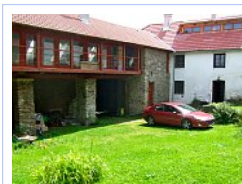
Dům Rudyho Linky na venkově

"Úžasné bylo to, že tady se vlastně nic nezměnilo. Tady všechno vypadalo úplně stejně. Všechny nápisy, Mlékárna, a všechno bylo úplně stejné."