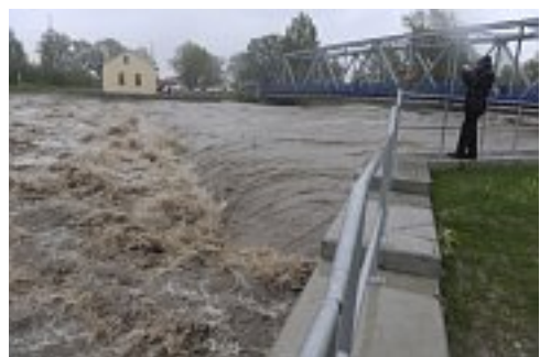
Splav na rozbouřené Ostravici v Ostravě-Hrabové, foto: ČTK

"Nejezdíme úsek Bohumín - Chalupki, tam je zaplavená trať z polské strany. Nejezdíme také na hlavním koridoru v úseku Ostrava Svinov - Polanka nad Odrou. Tam všechnu osobní dopravu vedeme odklonem přes Ostravu Vítkovice. Vznikají tam zpoždění zhruba 30 minut, nicméně vlaková doprava je zachována. Potom další problémy v úseku Karviná - Louky nad Olší, v úseku Mosty u Jablunkova - Čadca došlo k poškození troleje. Komplikuje to dopravu směrem na Slovensko."