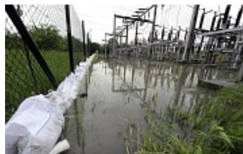
Rozvodna elektřiny v Bohumíně na Karvinsku

S vypětím všech sil bojují s živlem energetici. Tisíce domácností jsou na Moravě kvůli povodním bez proudu. Velká voda zaplavila některé distribuční trafostanice, které podle mluvčího ČEZu Jaroslava Jurči musely být na některých místech Zlínského kraje preventivně odpojeny: