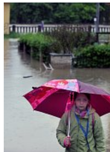
Následky povodně v Hranicích na Moravě, foto: ČTK

Vysoká voda bere s sebou všechno - majetek i životy. V Třinci se v noci na pondělí utopila devětašedesátiletá žena. Potok, který protékal přes její zahradu, ji odnesl o šedesát metrů dál. Situace se v postižených oblastech mění každou chvílí. V úterý dopoledne se povodňová situace v Moravskoslezském kraji postupně uklidňovala, srážky slábnou. Hladiny řek mají kulminaci pravděpodobně za sebou, i když například Olše v Českém Těšíně opět stoupala. Město Karviná, které bylo ještě v pondělí přístupné po silnici pouze přes sousední Polsko, se už také dostalo ze spárů vodního živlu. Jsou ale místa, jako například Bohumín nebo Troubky, které se staly tragickým symbolem záplav na Moravě v roce 1997, kde museli být lidé evakuováni ze svých domovů. V Bohumíně dokonce ze zaplavené nemocnice. Ne všichni ale chtěli své domovy opustit, říká starosta Bohumína Petr Vícha: