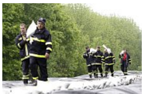
Hasiči zpevňují hráz řeky Moravy u Hodonína

Meteorologové doufají, že koncem týdne by se počasí mohlo definitivně umoudřit.