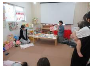
[ 0歳からの性教育 ]