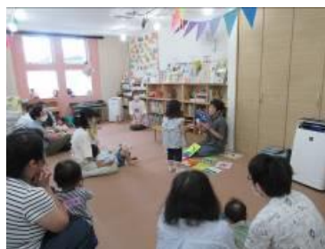
[ 絵本の読み聞かせ方 ]