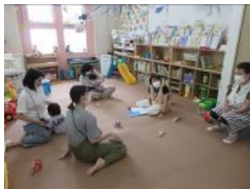
[ アンガーマネジメント ]