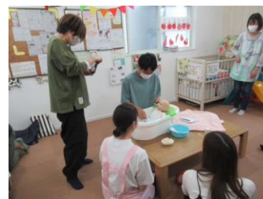
[ プレママ・プレパパ講座 ]