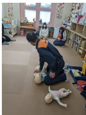
[ 乳幼児の応急手当 ]