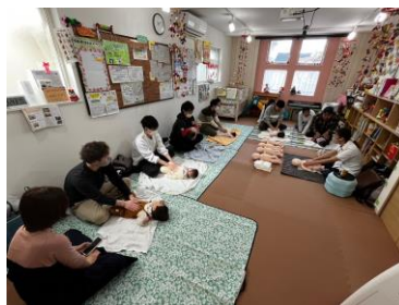
[ パパによる ベビーマッサージ ]